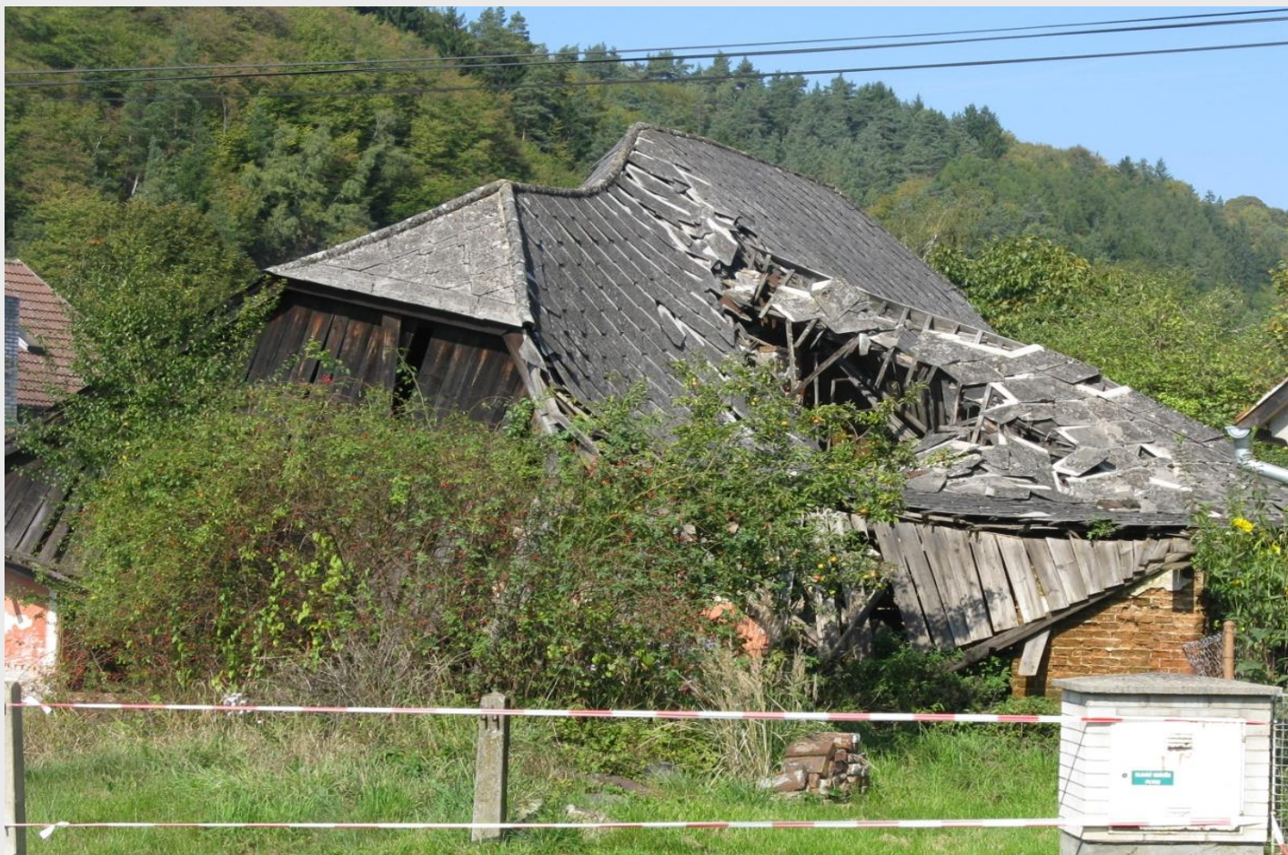
„Bezúdržbová stavba“ Pod Vírskou přehradou