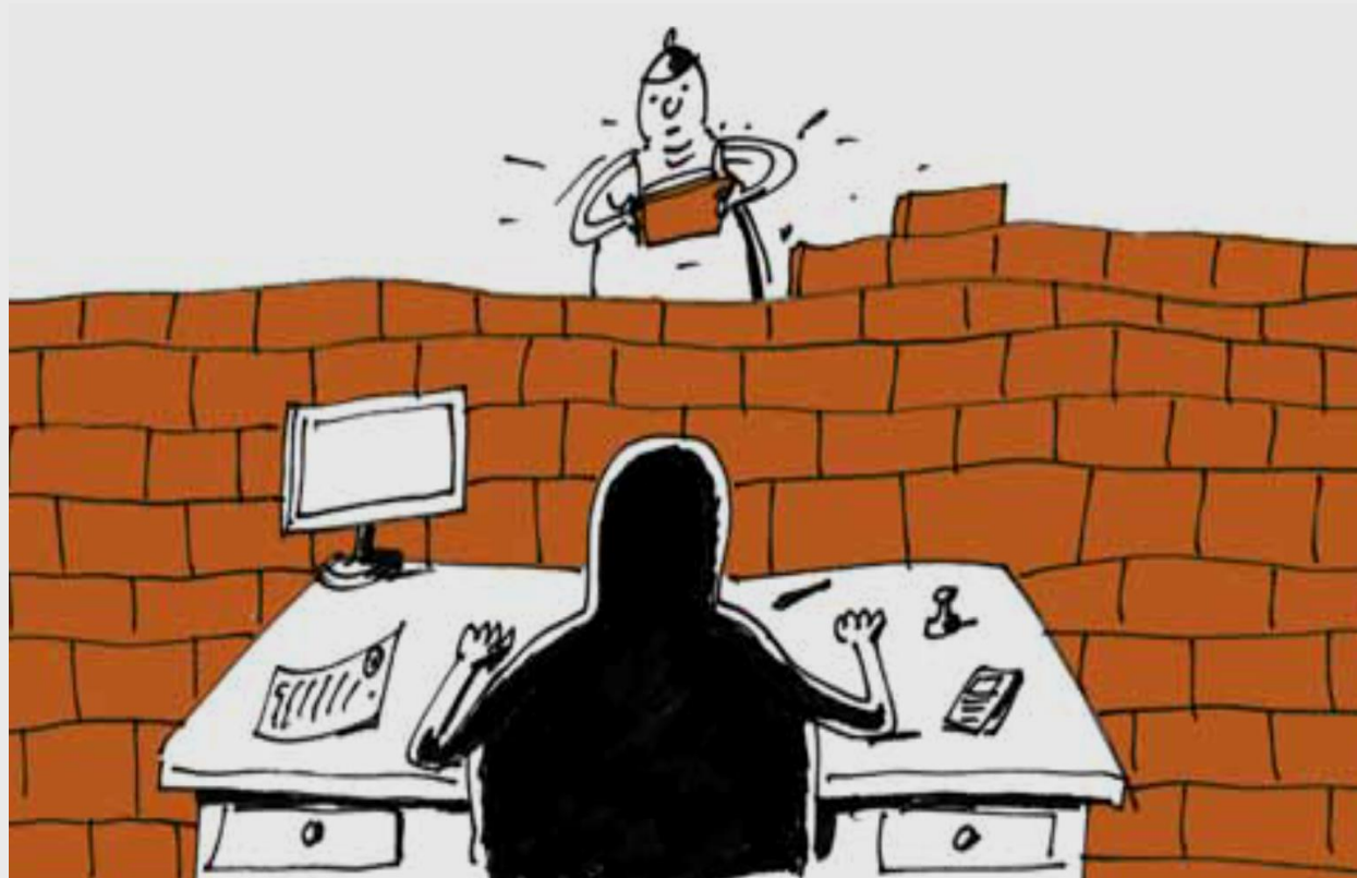
Kresba - Pavel Koutský, 2008